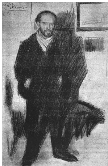
Portret van Pío Baroja door Picasso

Kijk hier voor onze auteurspagina van Pío Baroja.